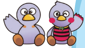
埼玉県マスコット 「コバトン&さいたまっち」