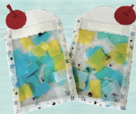
作るのはひとつだよ